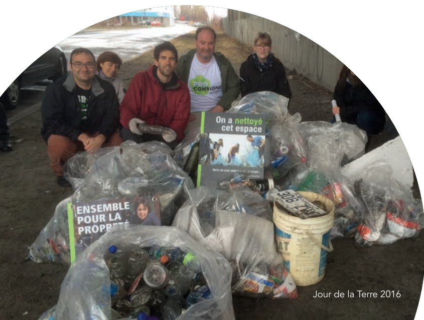
Jour de la Terre 2016

Présentation sur les critères de reconnaissance du SACAIS faite par le Regroupement des organismes en défense collective des droits (RODCD).