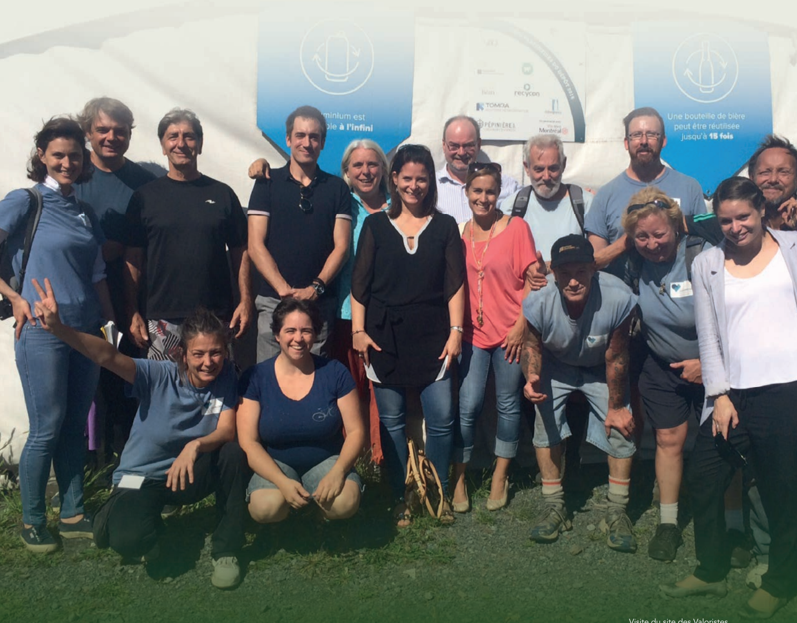
Visite du site des Valoristes