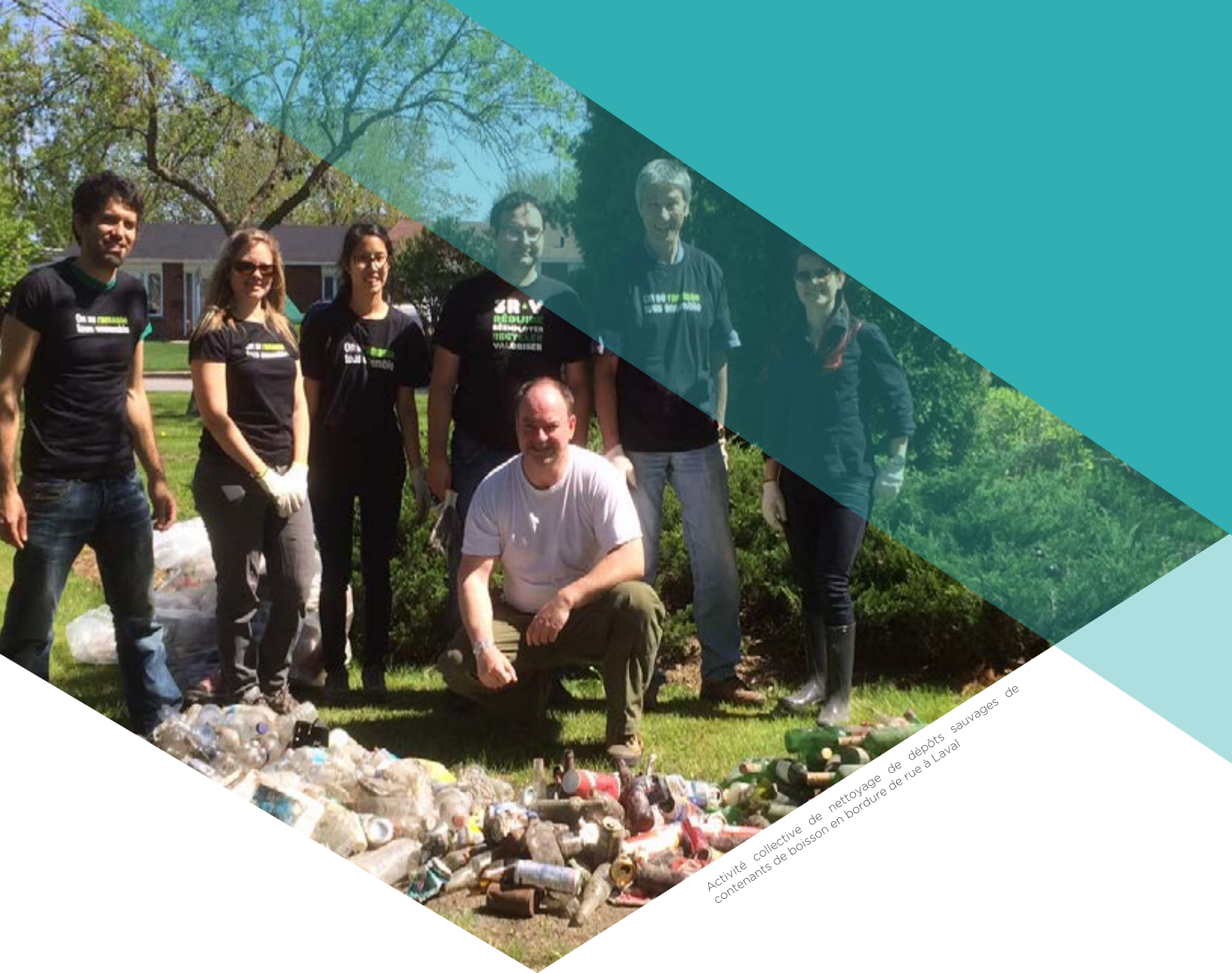
Activité collective de nettoyage de dépôts sauvages de contenants de boisson en bordure de rue à Laval