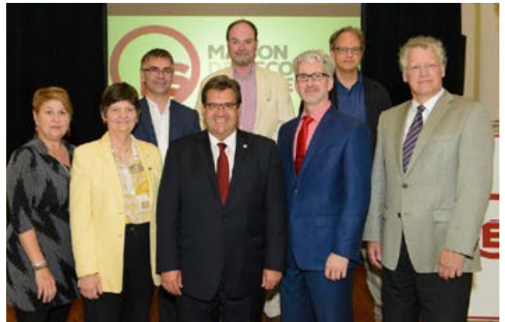
Inauguration de la Maison de l'Économie sociale en présence du maire de Montréal, M. Denis Coderre.