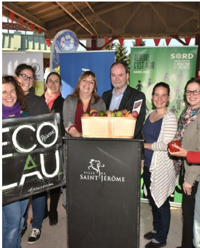
Lancement de la 17e édition de la SQRD

Le Front commun québécois pour une gestion écologique des déchets (FCQGED) est un organisme sans but lucratif qui a été fondé en 1991. Il a été formé par des citoyens et des groupes de base qui voulaient à l'origine contrer des projets d'importation massive de déchets en provenance des États-Unis dans des mégasites d'enfouissement en sol québécois. Tout en proposant des solutions aux problèmes sociaux et environnementaux liés à cet enjeu, l'organisme réclamait également une commission d'enquête sur la gestion des déchets solides dans la province.